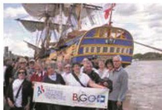
▼ OCTOBRE. Un exemple de journée amicale, ici à Bordeaux, dans le sillage de l' Hermione .