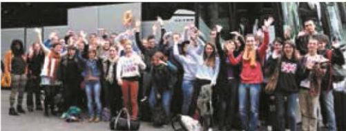
▼ JUIN. Départ des jeunes du programme « intermunicipalités » : 112 jeunes des deux pays et 61 villes participantes.