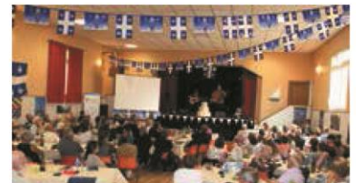
▼ OCTOBRE. Des soirées fleurdelysées en régions, ici à Cluny pour les 40 ans de l'association bourguignonne.