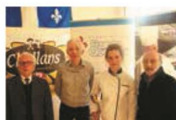
► FÉVRIER. Concours culinaires régionaux pour la 6 e édition des Trophées France-Québec. Finale le 2 avril à Paris.