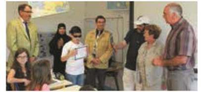
▼ JUIN. Remise en Lorraine, à un jeune élève non-voyant, du 1 er prix CM2 de la « dictée francophone », effectuée par plus de 15 000 participants en France.