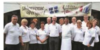
▼ AOÛT. Une délégation du Périgord aux Fêtes Gourmandes de Lanaudière au Québec.