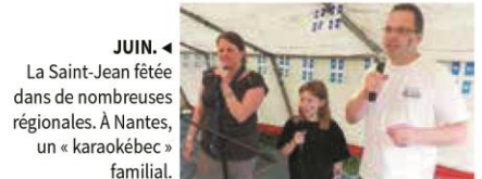
JUIN. ◀ La Saint-Jean fêtée dans de nombreuses régionales. À Nantes, un « karaokébec » familial.