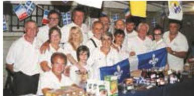
▼ JUIN. Le 24 juin à Paris, fête du Québec, les régionales de l'Ile-de-France et le bureau national mobilisés.