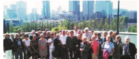
▼ SEPTEMBRE. Des Bourguignons, en voyage au Québec, reçus à l'Hôtel de ville de Montréal.