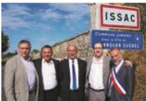
▼ SEPTEMBRE. Signature d'un jumelage entre Issac-Bourgnac (Dordogne) et Chandler (Gaspésie).