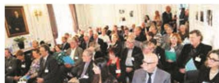
► DÉCEMBRE. A la Délégation du Québec à Paris, conseil national élargi aux présidents des associations régionales.