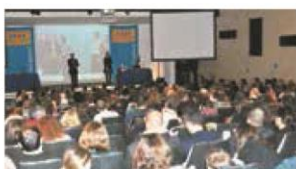
JANVIER. ◀ Des réunions d'information sur l'immigration au Québec. Ici à Nîmes.