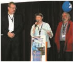
► MAI 2014. Les 12 volumes « Ces villes et villages de France, berceau de l'Amérique française », réalisés par les bénévoles du réseau, tous parus.

Le réseau France-Québec, avec ses 60 associations « régionales » et ses milliers de membres, est actif toute l'année. Voici, en photos, un florilège d'actions menées depuis l'Assemblée générale de Besançon fin mai 2014.