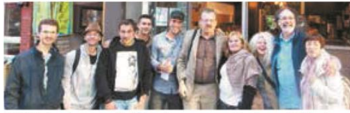
▼ JUIN. Des slameurs, finalistes du concours « Vive la parole libre ! », en tournée au Québec.