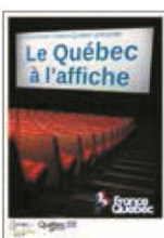
► JANVIER 2015. Quatrième édition de la tournée cinéma.