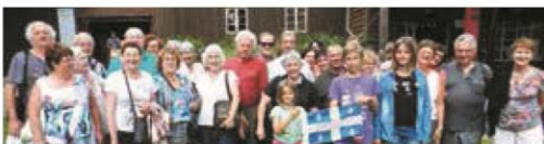
▼ JUILLET. Des membres de régionales de l'Est se retrouvent à Bussang (Vosges) où le théâtre québécois est à l'honneur.