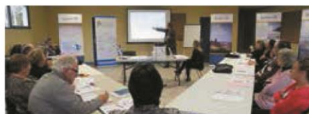
▼ NOVEMBRE. Journées de formation à Bergerac pour les responsables d'associations du Sud-Ouest.