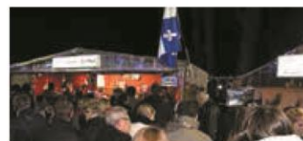
► DÉCEMBRE. Plusieurs associations font découvrir les produits québécois lors des marchés de Noël. Ici, à Laval.