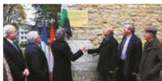
▼ NOVEMBRE. Un pionnier honoré par une plaque à Bourg-en-Bresse.