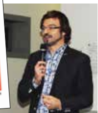
▼ NOVEMBRE. Tournée avec le documentaire « La langue à terre » du Québécois Jean-Pierre Roy.