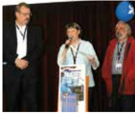
► MAI 2014. Les 12 volumes « Ces villes et villages de France, berceau de l'Amérique française », réalisés par les bénévoles du réseau, tous parus.

Le réseau France-Québec, avec ses 60 associations « régionales » et ses milliers de membres, est actif toute l'année. Voici, en photos, un florilège d'actions menées depuis l'Assemblée générale de Besançon fin mai 2014.