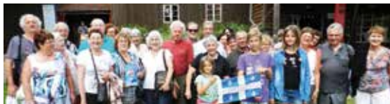
▼ JUILLET. Des membres de régionales de l'Est se retrouvent à Bussang (Vosges) où le théâtre québécois est à l'honneur.