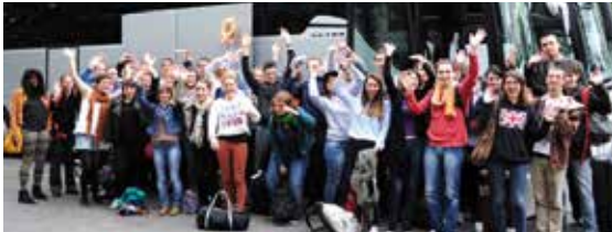
▼ JUIN. Départ des jeunes du programme « intermunicipalités » : 112 jeunes des deux pays et 61 villes participantes.