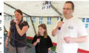
JUIN. ◀ La Saint-Jean fêtée dans de nombreuses régionales. À Nantes, un « karaokébec » familial.