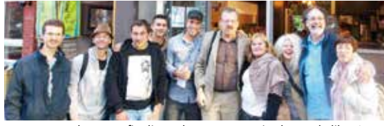
▼ JUIN. Des slameurs, finalistes du concours « Vive la parole libre ! », en tournée au Québec.