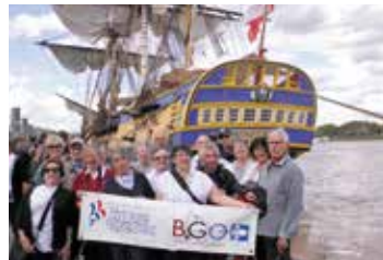
▼ OCTOBRE. Un exemple de journée amicale, ici à Bordeaux, dans le sillage de l' Hermione .