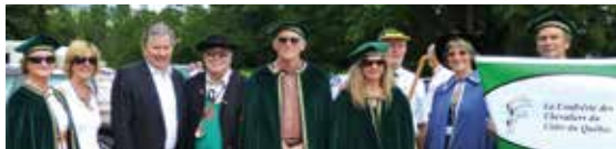
► JUILLET. En Auvergne, un rassemblement inédit de confréries gastronomiques de France et du Québec.