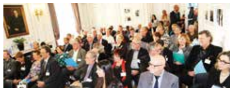
► DÉCEMBRE. A la Délégation du Québec à Paris, conseil national élargi aux présidents des associations régionales.