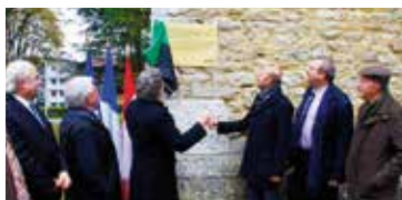
▼ NOVEMBRE. Un pionnier honoré par une plaque à Bourg-en-Bresse.