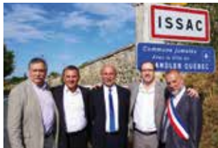
▼ SEPTEMBRE. Signature d'un jumelage entre Issac-Bournac (Dordogne) et Chandler (Gaspésie).