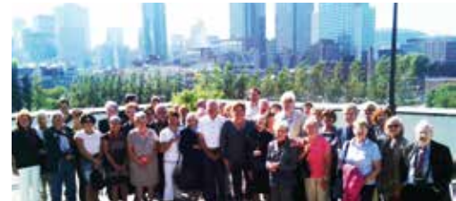
▼ SEPTEMBRE. Des Bourguignons, en voyage au Québec, reçus à l'Hôtel de ville de Montréal.