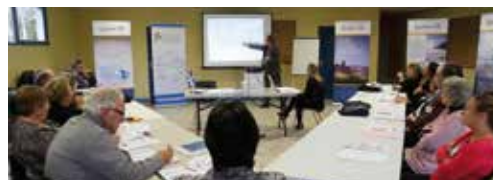
▼ NOVEMBRE. Journées de formation à Bergerac pour les responsables d'associations du Sud-Ouest.