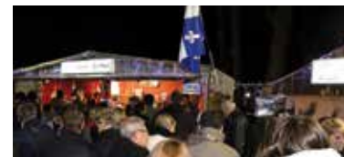
► DÉCEMBRE. Plusieurs associations font découvrir les produits québécois lors des marchés de Noël. Ici, à Laval.