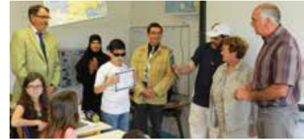
▼ JUIN. Remise en Lorraine, à un jeune élève non-voyant, du 1 er prix CM2 de la « dictée francophone », effectuée par plus de 15 000 participants en France.