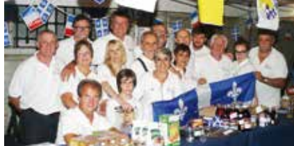
▼ JUIN. Le 24 juin à Paris, fête du Québec, les régionales de l'Île-de-France et le bureau national mobilisés.