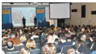
JANVIER. ◀ Des réunions d'information sur l'immigration au Québec. Ici à Nîmes.