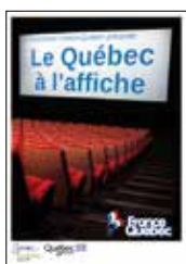
► JANVIER 2015. Quatrième édition de la tournée cinéma.