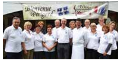
▼ AOÛT. Une délégation du Périgord aux Fêtes Gourmandes de Lanaudière au Québec.