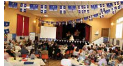
▼ OCTOBRE. Des soirées fleurdelysées en régions, ici à Cluny pour les 40 ans de l'association bourguignonne.