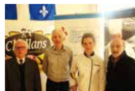
► FÉVRIER. Concours culinaires régionaux pour la 6 e édition des Trophées France-Québec. Finale le 2 avril à Paris.