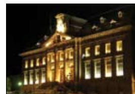
SERVICE PATRIMOINE LANGRES

L'Hôtel de ville , dans la partie nord de la ville intra muros. Venir à pied si possible. Sinon stationnement sur la place éponyme ou les petites places proches.