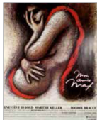
Mon ami Max de Michel Brault (1994) avec Geneviève Bujold et Marthe Keller. Drame.