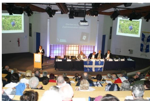
Plus de 240 participants à cette assemblée 2013