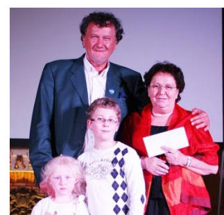
Les présidents de Val d'Oise et Guyane avec les enfants qui ont effectué le tirage

La souscription nationale a obtenu un grand succès : 11 985 billets ont été vendus. Ainsi, près de 12 000 euros ont été récoltés pour les Régionales participantes et autant pour l'Association nationale moins les frais et les gros lots. Les billets gagnants ont été tirés vendredi 10 mai lors du gala de l'Assemblée générale organisé à l'Hôtel de ville de Tours. Les deux premiers gros lots, soit 2 x 2 billets d'avion aller-retour le Québec, ont été remportés dans le Val d'Oise et en Guyane. Celui de la souscription régionale a, quant à, lui été remporté en Touraine.