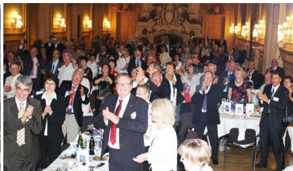
Une belle soirée de gala à l'Hôtel de ville de Tours

Lors du pont de l'Ascension, l'assemblée générale de l'Association France-Québec s'est tenue à Tours et Saint-Avertin, fort bien organisée par l'équipe de Touraine-Québec. Plus de 240 adhérents, représentant 51 Régionales (sur 63), ont participé aux travaux et ont voté à l'unanimité le rapport moral et d'activités présenté. Le rapport financier a été adopté par l'assemblée (moins deux abstentions). Le relèvement de la quote-part 2014 de 7,5 euros à 8 euros a été voté par l'assemblée (trois votes contre et deux abstentions). Exceptionnellement, les participants ont réfléchi en ateliers sur « le réseau vers de nouveaux horizons », en prélude au congrès commun avec Québec-France, en juillet à Montréal. Le Premier ministre Jean-Marc Ayrault avait adressé un message à l'Assemblée générale. En 2014, l'AG se déroulera les 30 et 31 mai à Besançon, organisée par Franche-Comté-Québec.