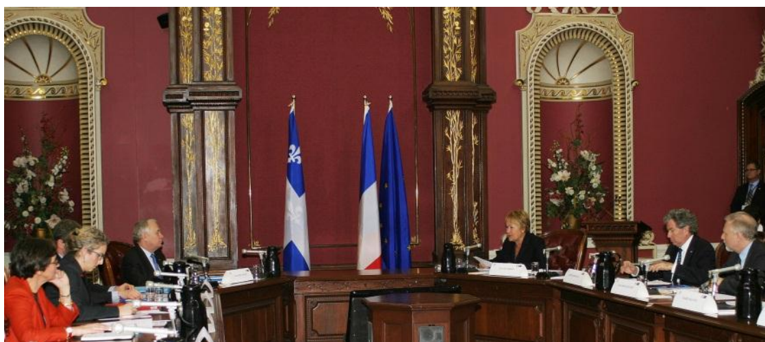
La rencontre ministérielle.

A propos de la Commission permanente de coopération franco-québécoise, qui se réunit ce jeudi 21 mars à Paris, « les Premiers Ministres soulignent le caractère concret des travaux de la CPCFQ, ainsi que sa capacité à s'adapter et à développer des partenariats innovants. Ils encouragent cette instance essentielle au partenariat franco-québécois à poursuivre ses travaux dans une perspective d'efficacité et d'optimisation des moyens. Fort conscients du contexte budgétaire actuel et des efforts consentis de part et d'autre, ils réitèrent leur volonté de maintenir la coopération franco-québécoise au cœur des échanges entre les deux gouvernements dans un esprit de partenariat, d'engagement mutuel et de parité. »