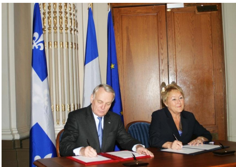
La signature du relevé de décision.

La dernière « rencontre alternée » officielle entre les Premiers ministres de France et du Québec remontait à novembre 2010 à Paris (FQM n°154). La 17e rencontre vient d'avoir lieu mi-mars au Québec. Après un passage par Ottawa et Toronto, Jean-Marc Ayrault a participé à un dîner conférence de la Chambre de commerce française à Montréal, dialogué avec des jeunes à l'occasion des 45 ans de l'OFQJ, discuté avec la Première ministre Pauline Marois... (reportage dans le prochaine France-Québec mag qui paraîtra fin avril, début mai).